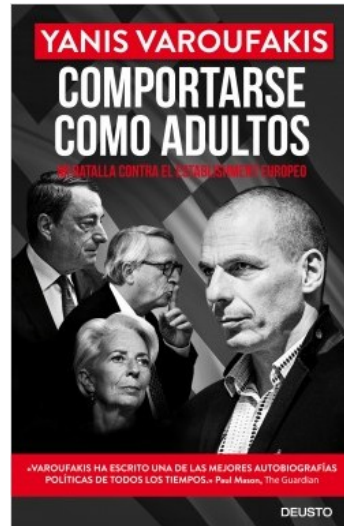
Comportarse como adultos Yanis Varoufakis

CUINA Legumbres: 150 recetas vegetarianas con superalimentos.