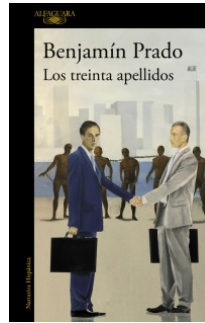
Los treinta apellidos. Benjamín Prado