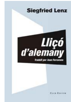
Lliçó d'alemany Siegfried Lenz